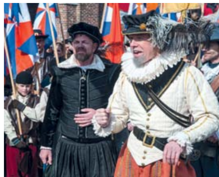
Watergeuzen in Brielle.