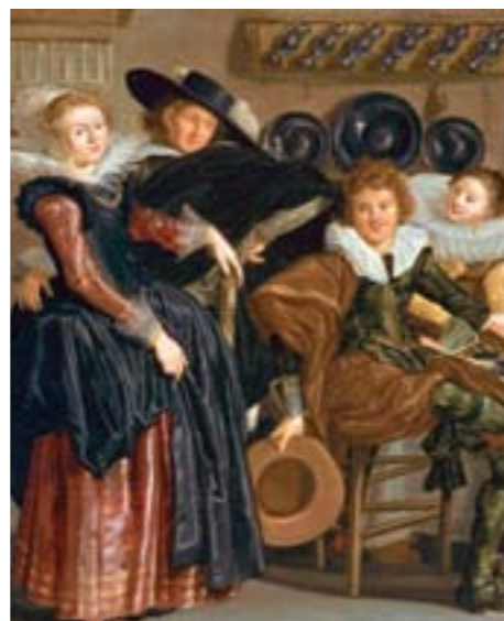
Jonge mensen in de Gouden Eeuw.