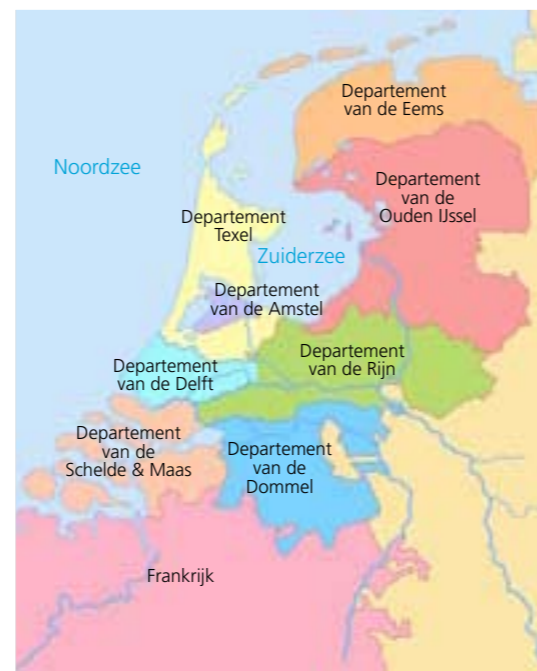
Nederland rond het jaar 1800.