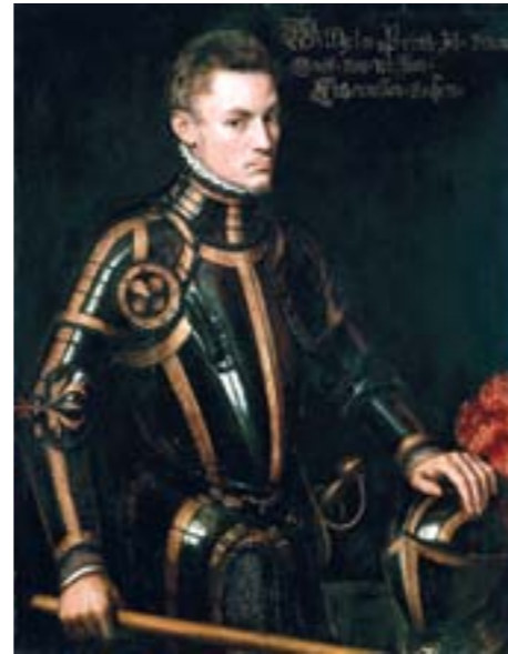
Willem van Oranje.

De Spanjaarden probeerden nog om deze steden terug te veroveren. Sommige werden daarom maandenlang belegerd, zoals Leiden in 1574. Maar uiteindelijk kwam het gewest Holland en Zeeland stevig in handen van Willem van Oranje. Als belangrijkste protestantse edelman werd hij de leider van de opstand.