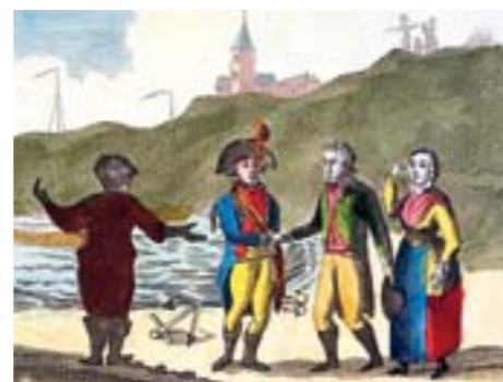
Willem V neemt afscheid in Scheveningen.