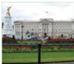
In Buckingham Palace in Londen woont de koning(in) van het Verenigd Koninkrijk.

In Wales wordt Engels en Welsh gesproken. De grootste stad in Wales is Cardiff. In Wales zijn weinig steden. De steden die er zijn liggen in het zuiden. Het landschap is ruig en bergachtig en je vindt er nog veel oude kastelen.