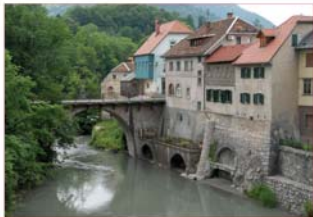
De Sora rivier in Slovenië

Via de havens Varna en Burgas aan de Zwarte Zee worden onder andere fruit, wijn, rozenolie en tabak uitgevoerd.