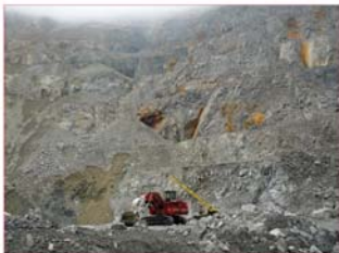
Kopermijn in Bulgarije.

In de republiek Roemenië wonen ongeveer 22 miljoen mensen. De hoofdstad is Boekarest. Roemenië is lid van de EU. Er heerst een land-