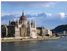
Het parlement in Budapest.

Er worden nogal wat industrieproducten uitgevoerd, vooral over de Donau. Er zitten in Hongarije weinig delfstoffen in de bodem. Veel grondstoffen, maar ook energie, moeten worden ingevoerd uit andere landen.